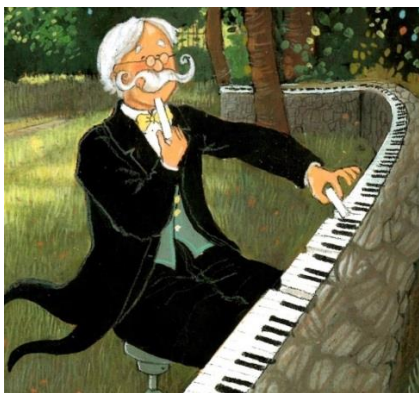
Camille Saint-Saëns (Paris 1835 – Alger 1921)

Le jeune Camille Saint-Saëns est un enfant prodige, à 2 ans et demi il apprend le piano et à 5 ans il compose sa première pièce.